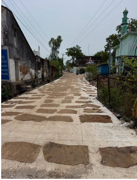
మసీదు గల్లిలో సీసీ రోడ్డు నిర్మాణం కూడా పూర్తయిందని చెప్పారు. పాత మసీదు గల్లి రోడ్డు పనులకు 2024లో మున్సిపల్ అత్యవసర బడ్జెట్లో నిధులు కేటాయించి శంకుస్థాపన జరిగినప్పటికీ,

పరకాల, జూలై 10 (పీసీడబ్ల్యూ న్యూస్): పరకాల మున్సిపాలిటీ 14వ వార్డులో TUFIDC ప్రత్యేక నిధులతో రూ.కోటికి పైగా విలువైన అభివృద్ధి పనులు చేపట్టి, వాటిలో అత్యధిక భాగాన్ని పూర్తి చేయించిన ఎమ్మెల్యే రేవూరి ప్రకాష్ రెడ్డికి మాజీ కౌన్సిలర్ మార్కెట్ ఉమాదేవి రఘుపతి గౌడ్ హృదయపూర్వక కృతజ్ఞతలు తెలిపారు. గత మూడు దశాబ్దాలుగా వార్డు ప్రజలను తీవ్రంగా ఇబ్బంది పెట్టిన అంతర్గత డ్రైనేజీ సమస్యను, ముఖ్యంగా శ్రీ చెన్నకేశవ స్వామి ఆలయ పరిసరాల్లో నెలకొన్న సమస్యలను ఎమ్మెల్యే దృష్టికి తీసుకెళ్లినట్లు ఆమె పేర్కొన్నారు. ప్రజల భవిష్యత్ అవసరాలను దృష్టిలో ఉంచుకుని శాశ్వత పరిష్కారం లక్ష్యంగా 2024లో అంతర్గత డ్రైనేజీతో పాటు సీసీ రోడ్ల నిర్మాణానికి మార్కెట్ చేపట్టినట్లు తెలిపారు. తన కృషితో దాదాపు రూ.కోటి విలువైన అభివృద్ధి పనులకు ప్రతిపాదనలు సిద్ధమయ్యాయని వెల్లడించారు. ఆ ప్రతిపాదనలకు ఎమ్మెల్యే రేవూరి ప్రకాష్ రెడ్డి సానుకూలంగా స్పందించి, 2025లో TUFIDC ప్రత్యేక నిధుల ద్వారా 14వ వార్డులోనే తొలుత పనులు ప్రారంభించారని తెలిపారు. ప్రస్తుతం సుమారు 95 శాతం పనులు పూర్తయ్యాయని, పాత