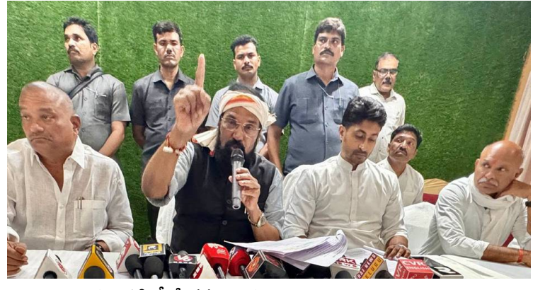
వెల్లిడించారు. ఎన్ఎల్బీసీ శ్రీశైలం జలాశయం నుంచి 40 టీఎంసీల నీటిని తరలించి 4.01 లక్షల ఎకరాలకు సాగునీరు, 618 ఎ+లోరెడ్ ప్రభావిత గ్రామాలకు సురక్షిత తాగునీరు, అలాగే పారిశ్రామిక అవసరాలకు నీటి సరఫరా అందుతుందని మంత్రి

వివరించారు. ఈ ప్రాజెక్టుకు సవరించిన పరిపాలనా అనుమతి వ్యయం సుమారు రూ.12,718 కోట్లు అని తెలిపారు. వసుల వేగం ఎంత ముఖ్యమైనదైనా, కార్కుల భద్రత దానికంటే ముఖ్యమని మంత్రి స్పష్టం చేశారు. టన్నెల్ అంతటా తగిన లైటింగ్, సమర్థం తమైన వెంటిలేషన్, సీనియర్ జియాలజిస్టులు, అధారితీ ఇంజనీర్లు, నిపుణులు నిరంతర పర్యవేక్షణతో పనులు కొనసాగించాలని ఆదేశించారు. నాణ్యతా ప్రమాణాలపై ఎలాంటి రాజీ ఉండకూడదని స్పష్టం చేశారు. స్కాల్ పద్ధ పనిచేసే నిల్వగిరి ఇప్పటికీ మూడింతలు పెంచినట్లు, అదనపు యంత్రాలు, ప్రత్యేక పరికరాలు, సాంకేతిక నిపుణులను సమీకరిస్తున్నట్లు తెలిపారు. యంత్రాల రవాణా, కస్టమ్స్ అనుమతులు,