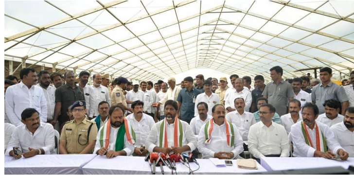
ఖమ్మం,జూన్ 29(పీసీడబ్ల్యూ న్యూస్): ఇందిరమ్మ ప్రజా ప్రభుత్వం చేపడుతున్న రైతు సంక్షేమ, ప్రజా కార్యక్రమాలను మెచ్చి వరణ దేవుడు కూడా కరుణించడాని ఉప ముఖ్యమంత్రి భట్టి విక్రమార్క తలపెట్టిన రైతు ఆశీర్వాద సభ ప్రాంతాన్ని సోమవారం మధ్యాహ్నం ఉప ముఖ్యమంత్రి భట్టి విక్రమార్క వ్యవసాయ శాఖ మంత్రి తుమ్మల నాగేశ్వరరావుతో కలిసి మిగతా2లో...

● రైతు భరోసా పంపిణీ తరువాత రైతు ఆశీర్వాద సభ ● వరుణుడు కూడా కరుణించడం ఆనందదాయకం ● డిప్యూటీ సీఎం మల్లు భట్టి విక్రమార్క