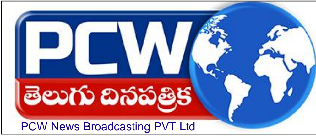
PCW News Broadcasting PVT Ltd

జల్లా ఎస్సీ శబరివేల తొందరగా డీఎస్సీ కార్యాలయాన్ని ఆకస్మికంగా తనిఖీ