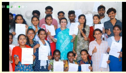
ఠారూరు ప్రతినిధి, జూన్ 29(పీసీడబ్ల్యూ న్యూస్): పాలకుర్తిలో ఏర్పాటుచేసిన మెగా జాబ్ మేళాకు విశేష స్పందన లభించింది. ఎంతోమంది యువత యువకులు ఈ జాబ్ మేళాకు హాజరు కాగా అందులో కొందరికి జాబ్ మేళాలో ఎంపికయ్యారు. పాలకుర్తి మెగా జాబ్ మేళాలో ఎంపికైన యువతకు