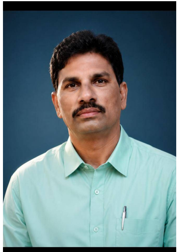
బెలికాం, బ్యాంకింగ్ రంగాలలో పురోగతికి పునాదులు పివి హయాంలోని పథ్యాని చెప్పటంలో సందేహం లేదు. సింగపూర్, మలేషియా, థాయిలాండ్, అమెరికా, ఇజ్రాయల్ వంటి దేశాలతో దౌత్య సంబంధాలను నెలకొల్పిన రాజకీయ చాణిక్యుడు పివి నరసింహారావు. 1991 లో పోక్రాన్ లో అణుశక్తి పరీక్షలను ప్రారంభించడం దేశం యొక్క సైన్స్ & టెక్నాలజీ సమర్థతను తెలుపుతుంది. భారతదేశ ఖ్యాతిని, అభివృద్ధిని ప్రపంచ చిత్రపటంలో నెలకొల్పిన పీవీ నరసింహారావు 2004 డిసెంబర్ 23న తుది శ్వాస విడిచారు, అనంతరం 2024 లో భారత్ ప్రభుత్వం అత్యున్నత భారతరత్న బిరుదు తో సత్కరించింది.

రాజకీయ పదవులను బలహీన వర్గాల వారికి కట్టబెట్టి సామాజిక న్యాయాన్ని సాధించారు. తర్వాత కాలంలో పార్లమెంటు సభ్యుడుగా ఎన్నికైనందున తన మకాం ను ఢిల్లీకి మార్చి ఇందిరాగాంధీ, రాజీవ్ గాంధీ మంత్రివర్గాలలో చోో, రక్షణ మరియు విదేశీ వ్యవహారాల శాఖల మంత్రిగా పనిచేసే తన ప్రతిభను కనపరిచారు. భారత ప్రధానిగా పీవీ . 1991 నుండి రాజకీయాలకు దూరంగా ఉండాలన్న నిర్ణయానికి వచ్చారు పీవీ . కానీ అనూహ్య పరిస్థితుల్లో రాజీవ్ గాంధీ హత్య అనంతరం దేశంలో ఉన్న సంక్షిప్త పరిస్థితిని చక్కబెట్టుటకు కాంగ్రెస్ అధిష్టానం సమర్థుడు, వివాద రహితమైన పీవీ నరసింహారావు కి ప్రధానమంత్రిగా అవకాశం కల్పించింది. దీనితో 1991 జూన్ 21 న దేశ 9 వ ప్రధాని గా పీవీ ప్రమాణ స్వీకారం చేశారు. భారత ప్రధానిగా పదవినీ స్వీకరించిన రోజుల్లో దేశం ఆర్థిక సంక్షోభాన్ని ఎదుర్కొంటుంది . కేవలం 15 రోజులకు సరిపడా దాలద్లు మాత్రమే ఆర్థిక దగ్గర ఉంది. బంగారం తాకట్టు పెట్టవలసిన దుస్థితి నెలకొంది. వీటిని నివారించుటకు అనేక నూతన సంస్కరణలను చేయక తప్పలేదు. వాటిలో విదేశీ పెట్టుబడులకు ద్వారాలు తెరవడం, మూలధన మార్కెట్ ను సంస్కరించటం, నియంత్రణ రహిత దేశీయ వ్యాపారం, వాణిజ్య విధానాలను సంస్కరించటం మరియు ఎల్విజి విధానాలు ముఖ్యమైనవి. వీటి ఫలితంగా వృద్ధి రేటు 3 శాతం నుండి 7 శాతానికి పెరిగింది. ఈనాడు మనం అనుభవిస్తున్న ఐటీ ,