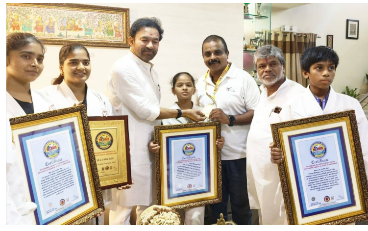
దూరంగా ఉంచుతూ క్రీడాస్పృద్ధి, క్రమశిక్షణను గ్రహీతలను అభినందించి సత్కరించారు.