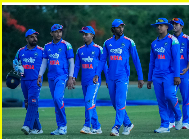
డీఎంఎస్ పద్ధతిలో అప్లెనిస్టాన్ ఏ విజయం సాధించింది. అప్లెనిస్టాన్ జట్టులో ఇప్లెనిస్టాన్ మీర్ (75 బంతులు), బిషిర్ షా (51 బంతులు) హాఫ్ సెంచరీలతో రాణించారు. భారత బౌలర్లలో

2026 బ్రె సీరీస్ లో యువ భారత్ కు షాక్ తగిలింది. దంబుల్లా వేదికగా జరిగిన రెండో మ్యాచ్ లో భారత్ - ఏపై అప్లెనిస్టాన్ - ఏ డక్ వర్త్ లాయిస్ పద్ధతిలో 4 పరుగుల తేడాతో నెగ్గింది. మ్యాచ్ కు వర్షం అంతరాయం కలిగించడంతో తొలుత ఆరును 49 ఓవర్లలో కుదించారు. మొదట బ్యాటింగ్ చేసిన టీమ్ ఇండియా 349-9 భారీ స్కోర్ చేసింది. అనంతరం మరోసారి వర్షం ఆటకు అంతరాయం కలిగించింది. దీంతో అప్లెనిస్టాన్ టూర్నీ నుండి 38 ఓవర్లలో 294 గా నిర్ణయించారు. అయితే రెండో ఇన్స్వింగ్ లో అప్లెనిస్టాన్ 25.5 ఓవర్లకు 177-2 వద్ద ఉన్న సమయంలో మళ్లీ వర్షం కురిసి మళ్లీ ఆట ఆగిపోయింది. డక్ వర్త్ లాయిస్ ప్రకారం అప్పటికి అప్లెనిస్టాన్ నాలుగు పరుగుల ముందంజలో ఉంది. దీంతో