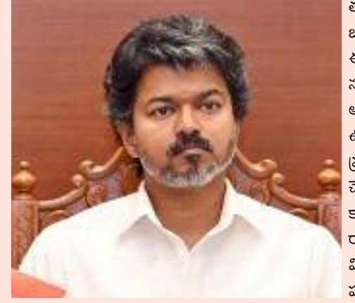
చెన్నై, మే 26 (పిసిడబ్ల్యూ న్యూస్): తమిళనాడు ముఖ్యమంత్రి జోసెఫ్ విజయ్ బుధవారం ఢిల్లీ పర్యటన చేయనున్నారు. ఈ పర్యటనలో భాగంగా ఆయన ప్రధాని సరేంద్ర మోడీని కలిసే అవకాశం ఉందని ఆ పార్టీ వర్గాలు వెల్లడించారు. బుధవారం ఉదయం సీనియర్ అధికారులు, రాష్ట్ర ప్రధాన కార్యదర్శితో సహా విజయ్ ఢిల్లీకి చేరుకోనున్నారు. అలాగే ఈ పర్యటనలో కాంగ్రెస్ సీనియర్ నేత సోనియాగాంధీ, రాహుల్ గాంధీని ఆయన కలవనున్నారు. విజయ్ ముఖ్యమంత్రి అయ్యాక ఇదే తొలి పర్యటన కావడం గమనార్హం.