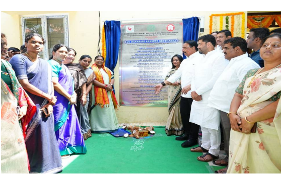
హైదరాబాద్, మే 26 (పిసిడబ్ల్యూ న్యూస్): మహిళల భద్రత, వారి గౌరవానికి తమ ప్రభుత్వం ప్రాధాన్యం ఇస్తోందని తెలంగాణ వంచాయతీ రాజ్, గ్రామీణాభివృద్ధి, మహిళా శిశుసంక్షేమ శాఖ మంత్రి సీతత్త చెప్పారు. మహిళల ఉన్నత

తెలంగాణ ప్రగతి అని మంత్రి సీతత్త వ్యాఖ్యానించారు. మహిళా సంఘాలకు పట్టి లేని రుణ పరిమితి పెంచుతున్నట్లు మంత్రి సీతత్త పేర్కొన్నారు. మహిళలను సంపద సృష్టించే శక్తిగా తీర్చిదిద్దుతున్నామని వ్యాఖ్యానించారు. మహిళల ఆదాయం పెరిగితే కుటుంబం బలపడుతుందని పేర్కొన్నారు. మంగళవారం బంజారాహిల్స్ లో సఖి నివాస వర్సింగ్ ఉమ్మడి హాస్టల్ ప్రారంభించారు. ఈ కార్యక్రమానికి మంత్రి సీతత్త హాజరై మాట్లాడారు. జూన్ 5వ తేదీన మహిళలకు సీఎం రేవంత్ రెడ్డి ఆర్డీని బియ్యం అందజేస్తారని తెలిపారు. మహిళా సంఘాల సోలార్ ఫ్లాట్లను బుధవారం డిప్యూటీ సీఎం మల్లు భట్టివిక్రమార్కు మధ్యలో ప్రారంభిస్తారని పేర్కొన్నారు. వర్సింగ్ ఉమ్మడి భద్రత తమ ప్రభుత్వ బాధ్యత అని తెలిపారు. గ్రామీణ మహిళలకు హైదరాబాద్ లో సురక్షిత వసతి కల్పిస్తున్నామని చెప్పుకోవచ్చు. సఖి నివాసలో 150 మంది మహిళలకు వసతి సౌకర్యం కల్పిస్తున్నామని వివరించారు. చిన్నపిల్లలతో వచ్చే తల్లులకు ప్రత్యేక సదుపాయాలు కల్పిస్తున్నామని వెల్లడించారు. రాష్ట్ర అభివృద్ధి మహిళల పురోగతితోనే ముడిపడి ఉందని సమీక్ష ప్రభుత్వం తమదని స్పష్టం చేశారు. మహిళలు కేవలం చిన్న చిన్న వ్యాపారాలకే పరిమితం కాకుండా పారిశ్రామికవేత్తలుగా ఎదగాలని సీఎం రేవంత్ రెడ్డి పిలుపునిచ్చారు గుర్తు చేశారు. ఇందుకోసం మండలాల్లో రైస్ మిల్లులు, గోదాన్లు, ఫ్యాక్టరీ పార్కులు ఏర్పాటు చేసుకోవడానికి ప్రభుత్వం 100 ఎకరాల వరకు ప్రభుత్వ భూములను కేటాయించడానికి సిద్ధంగా ఉందన్నారు. కార్పొరేట్ మార్కెట్ రంగంలోకి మహిళలను తీసుకెళ్లేందుకు మహిళా శక్తి సూపర్ బాజార్లను ఏర్పాటు చేయబోతున్నట్లు వెల్లడించారు.