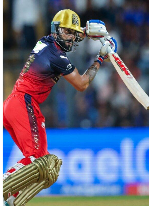
అడుతున్నాడు. దీనితో అతను శిఖర్ ధావన్, దినేశ్ కార్తీక్, కీరన్ పొలాడ్ వంటి దిగ్గజాల రికార్డును సమం చేశాడు. ఐపీఎల్ షేఆఫ్ లో అత్యధిక మ్యాచ్లు ఆడిన

రాయల్ చాలెంజర్స్ బెంగళూరు స్టార్ బ్యాటర్, రన్ మెషిన్ విరాట్ కోహ్లా ఖాతాలో మరో అద్భుతమైన మైలురాయి చేరింది. ఐపీఎల్ ప్రారంభమైన 2008 సీజన్ నుంచి ఆరేళ్ల బిట్టకు సమకాలిని పిల్లర్గా నిలిచిన కోహ్లా, ఐపీఎల్ 2026 క్వాలిఫైయర్ 1 మ్యాచ్ ద్వారా సరికొత్త చరిత్ర సృష్టించాడు. మే 26న ధర్మశాల వేదికగా గుజరాత్ ట్రైటాన్స్ తో జరుగుతున్న ఈ కీలక పోరులో బరిలోకి దిగడం ద్వారా, ఐపీఎల్ చరిత్రలోనే అత్యధిక షేఆఫ్స్ మ్యాచ్లు ఆడిన దిగ్గజాల సరసన కోహ్లా చోటు సంపాదించుకున్నాడు. ఐపీఎల్ చరిత్రను తిరగేస్తే విరాట్ కోహ్లా పేరిట లేని రికార్డు అంటూ లేదు. ఈ మెగా టోర్నీలో ఇప్పటివరకు అత్యధిక పరుగులు చేసిన బ్యాటర్ గా కోహ్లానే అగ్రస్థానంలో కొనసాగుతున్నాడు. అతను మొత్తం 9218 పరుగులు చేసి ఎవరికీ అందనంత ఎత్తులో నిలిచాడు. అంతేకాదు, ఐపీఎల్లో అత్యధిక హాఫ్ సెంచరీలు (76 హాఫ్ సెంచరీలు) చేసిన రికార్డు కూడా కోహ్లా పేరిటే ఉంది. అతని తర్వాత డేవిడ్ వార్నర్ ఉండగా, ప్రస్తుతం ఆడుతున్న యాక్టివ్ ప్లేయర్లలో కేవల రాయల్ 51 హాఫ్ సెంచరీలతో రెండో స్థానంలో ఉన్నాడు. ఈ గణాంకాల్లో ఐపీఎల్లో కోహ్లా సృష్టించిన సామ్రాజ్యానికి అద్దం పడుతున్నాయి. తాజాగా గుజరాత్ ట్రైటాన్స్ తో జరుగుతున్న క్వాలిఫైయర్ 1 మ్యాచ్లో కలిపి విరాట్ కోహ్లా తన కెరీర్లో 18వ ఐపీఎల్ షేఆఫ్ మ్యాచ్