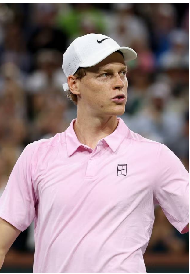
సిసర్ ప్రస్తుతం అద్భుతమైన ఫామ్ లో ఉన్నాడు. సిసర్ తన 29వ మ్యాచ్ గెలిచాడు. దీంతో ఈ ఇటాలియన్ ఓపెన్ గెలుపుకోసం ఇదే మొదటిసారి.

ఇటాలియన్ ఓపెన్ టైటిల్ ను కైవ ఇటలీ టెన్నిస్ స్టార్ జనిక్ సిసర్ సరికొత్త చరిత్ర సృష్టించాడు. ప్రతిష్టాత్మక ఇటాలియన్ ఓపెన్ టైటిల్ ను కైవసం చేసుకున్నాడు. ఈ టోర్నీలో తాజాగా జరిగిన మైసల్ లో ప్రపంచ నంబర్ వన్ సిసర్, నార్వేకు చెందిన కాస్పర్ రూడ్ ను 6-4, 6-4 తేడాతో వరుస సెట్లలో ఓడించాడు. దీంతో గత 50 ఏళ్లలో ఇటాలియన్ ఓపెన్ గెలిచిన తొలి ఇటలీ పురుష అటగాడిగా సిసర్ రికార్డు కొట్టాడు. చివరిసారిగా 1976లో ఇటలీ అటగాడు అడ్రియానో పనెట్టా ఈ టైటిల్ ను కైవసం చేసుకున్నాడు. ఇక టైటిల్ గెలిచిన అనంతరం సిసర్ మాట్లాడుతూ "ఈ క్రోఫీ 50 ఏళ్ల తర్వాత ఇటలీకి తిరిగి వచ్చింది. ఇది నాకు, యావత్ దేశానికి ఎంతో ప్రత్యేకమైన క్షణం" అని వ్యాఖ్యానించాడు. రెండుసార్లు ఫ్రాంచ్ ఓపెన్ పైసల్ లో గెలిచిన కాస్పర్ ఈ మైసల్ లో సిసర్ కు గట్టి సవాల్ విసిరాడు. మ్యాచ్ లో అద్భుతమైన ఆరంభం చేసి, తొలుత ఆధిక్యం సాధించాడు. అయితే కరెక్ట్ టైమ్ లో సిసర్ కమ్యూట్ ఇచ్చాడు. మ్యాచ్ పై పూర్తి నియంత్రణ సాధిస్తూ, లీడ్ లోకి దూసుకెళ్తాడు. అదే ఆధిక్యం కొనసాగిస్తూ మ్యాచ్ లో విజేతగా నిలిచాడు. అయితే మ్యాచ్ అనంతరం రూడ్ మాట్లాడుతూ "ఈ ఏడాది నువ్వు సాధిస్తున్న విజయాలను వర్తించడం కష్టం. చరిత్ర సృష్టించినందుకు అభినందనలు" అని సిసర్ కు శుభాకాంక్షలు తెలిపాడు. కాగా, కాస్పర్ రూడ్ పై సిసర్ 5-0 'పాడ్-టు-పాడ్' రికార్డుతో లీడ్ లో ఉన్నాడు.