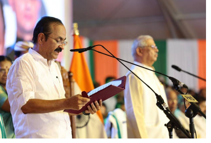
తిరువనంతపురం,మే 18 (పిసిడబ్ల్యూ న్యూస్): కేరళ కాంగ్రెస్ పార్టీ సీనియర్ నేత వీడీ సతీశన్ కేరళం రాష్ట్ర కొత్త ముఖ్యమంత్రిగా ప్రమాణ