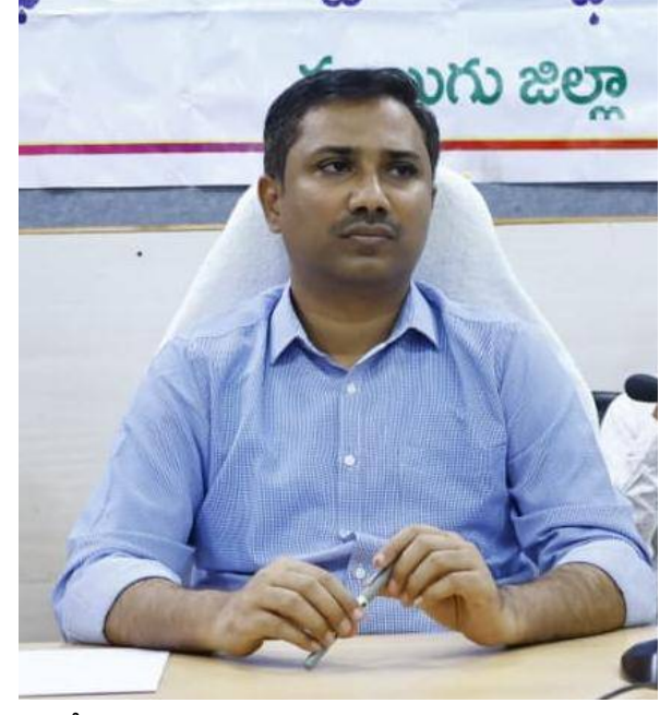
ఇంజనీరింగ్ ఉన్నత అధికారులు, సంబంధిత మండలాల తహశీల్దార్లు, ఎంపీడిఓలు, ఎంపీ ఓలు తప్పనిసరిగా హాజరు కావాలని ప్రకటనలో జిల్లా కలెక్టర్ తెలియజేశారు

సందర్భంగా జిల్లా కలెక్టర్ మాట్లాడుతూ నేరుగా ప్రజల సమస్యలను తెలుసుకుని వాటిని పరిష్కార మార్గం చూపడానికి రాష్ట్ర పంచాయతీరాజ్, గ్రామీణాభివృద్ధి, గ్రామీణ నీటి సరఫరా, మహిళా, శిశు సంక్షేమ శాఖ మంత్రి ధనసరి అనసూయ సీతక్క సమక్షంలో ములుగు మండలంలోని రాయనిగూడెం సర్పాపురం, మంగపేట మండలం రాజుపేట మల్లూరు గ్రామాల్లో ప్రజా దర్బార్ కార్యక్రమాన్ని నిర్వహించడం జరుగుతుందని, నాలుగు గ్రామాలకు చెందిన ఫిర్యాదుదారులు తమ స్థానిక సమస్యలు, ప్రభుత్వ పథకాలకు సంబంధించిన విన్నపాలను ఈ సందర్భంగా అధికారుల దృష్టికి తీసుకురావచ్చని ఆయన తెలిపారు. ప్రజలు ఈ అవకాశాన్ని సద్వినియోగం చేసుకొని, తమ సమస్యలపై దరఖాస్తులను అందజేయాలని ఈ సందర్భంగా కలెక్టర్ కోరారు. ప్రజా దర్బార్ కార్యక్రమానికి వచ్చే అర్హిదారులకు అన్ని మౌలిక వసతులు ఏర్పాటు చేయాలని సంబంధిత అధికారులను ఆదేశించారు. జిల్లా ఎస్ పి, డి ఎఫ్ ఓ, అదనపు కలెక్టర్ స్థానిక సంస్థలు, ఆర్డీఓ అన్ని శాఖల జిల్లా అధికారులు, అన్ని శాఖల