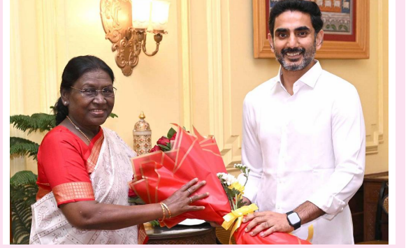
న్యూఢిల్లీ, ఏప్రిల్ 13 (పిసిడబ్ల్యూ న్యూస్): రాష్ట్రపతి ద్రౌపదీ ముర్ముకు ఎపి ప్రతినిధి బృందం కృతజ్ఞతలు తెలిపింది. అమరావతి బిల్లు అమల్లోకి రావడంతో మిగతావారో...