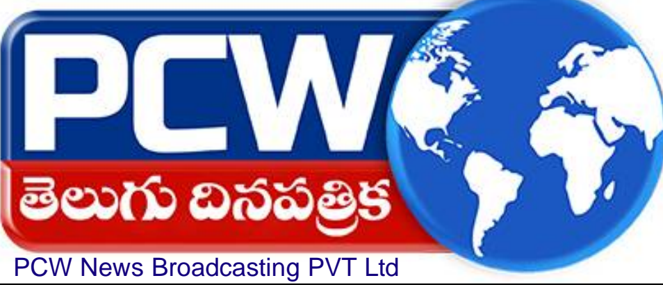
PCW News Broadcasting PVT Ltd