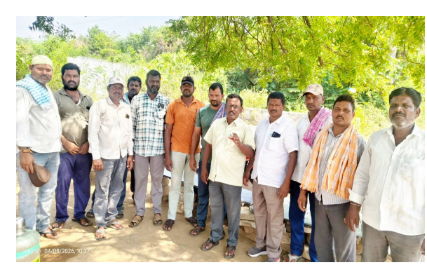
వేసవికాలంలో విద్యుత్ డిమాండ్ అధికంగా ఉన్న సమయంలో ఈ సమ్మె ర్యాష్ట్రానికి ఇబ్బందులు కలిగించే అవకాశముందని

- పల్లినెంట్ చేయాలంటూ టీయూసీబి డిమాండ్ - 23 వేల కార్మికుల సమ్మె.. ప్రభుత్వానికి హెచ్చరిక