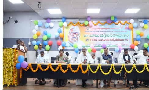
చేసిన సేవలను ఆయన చేసిన కృషిని కొనియాడారు. ఆయన ప్రస్థానం భావితరాలకు ఎంతో