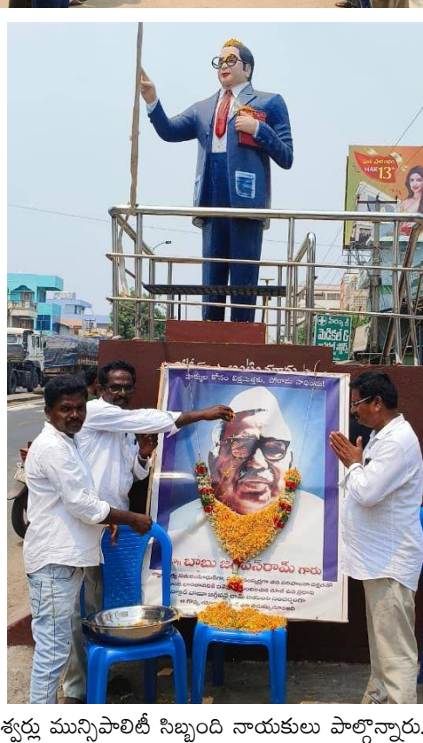
శ్వర్ణ మున్సిపాలిటీ నిబ్బంది నాయకులు పాల్గొన్నారు.