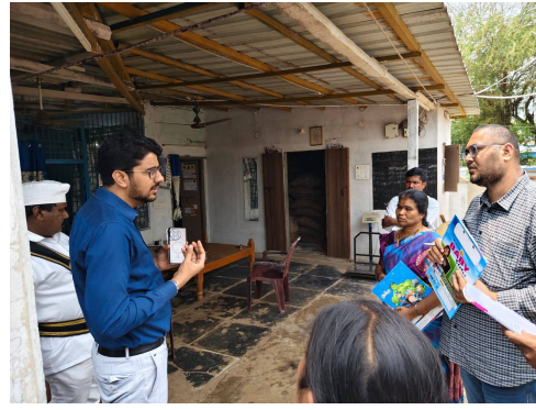
సంబంధిత అధికారులను ఆదేశించారు. ప్రభుత్వం అమలు చేస్తున్న పథకాలు నిజంగా ప్రజలకు చేరాలి కృషి చేయాలని ఆయన అధికారులకు సూచించారు. ఈ తనిఖీతో స్థానిక ప్రజల్లో నమ్మకం పెరిగింది.