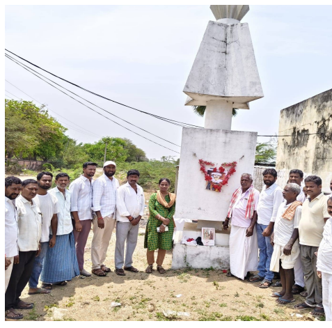
తెలంగాణ సాయుధ రైతాంగ పోరాటంలో దొడ్డి