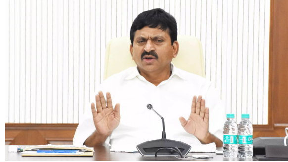
హైదరాబాద్, ఏప్రిల్ 1 (పిసిడబ్ల్యూ న్యూస్): తెలంగాణలో భూ వివాదాలకు ప్రభుత్వం చెక్ పెట్టనుంది. ఏప్రిల్ 2 నుంచి రాష్ట్ర వ్యాప్తంగా భూభారతి సేవలు అమలు చేయనుంది.

• ఐదు మండలాల్లో ప్రయోగాత్మకం • అధికారులతో సమీక్షించిన మంత్రి పాంగులేటి