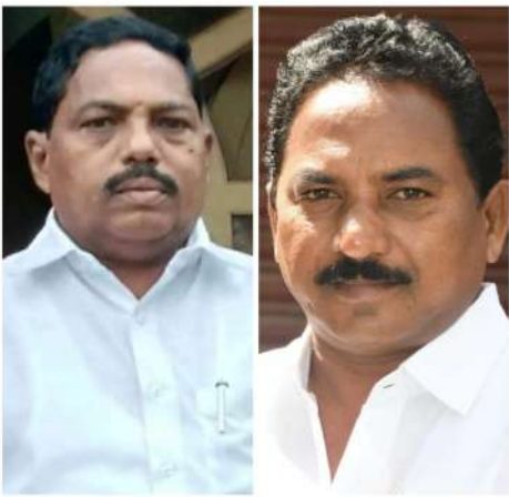
వ్యక్తం చేశారు. ఆమె చేసిన వ్యాఖ్యలు ఎస్సీ, ఎస్టీ అట్రాసిటీ చట్టం POA(1989) పరిధిలోకి వస్తాయని ,కాబట్టి ఆమెపై తక్షణమే