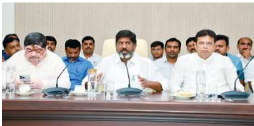
హైదరాబాద్,జూన్ 4(పిసిడబ్ల్యూ న్యూస్):తెలంగాణ ఉద్యోగ జేపీసీ నేతలతో ముఖ్యమంత్రి రేవంత్ రెడ్డి, ఉప ముఖ్యమంత్రితో పాటు అధికారుల కమిటీ సభ్యులూ పలుమార్లు సమావేశాలను