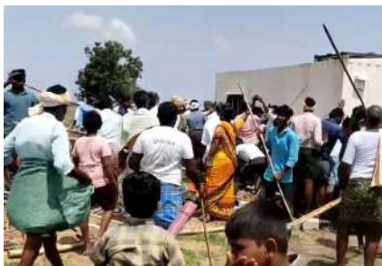
జోగులాంబ జూన్ 4(పిసిడబ్ల్యూ న్యూస్): ఇథనాల్ కంపెనీ ఏర్పాటును వ్యతిరేకిస్తూ.. ప్రజలు ఆందోళనకు దిగడంతో గద్వాల జిల్లాలో

కంపెనీ కార్లు, టెంట్లు దగ్ధం చేసిన రైతులు...గద్వాల జిల్లా ధన్వాడలో తీవ్ర ఉద్రేకత