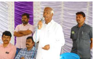
హనుమకొండ, మే 21(పిసిడబ్ల్యూ న్యూస్): తెలంగాణ రాష్ట్ర ప్రభుత్వంపై 8లక్షల కోట్ల