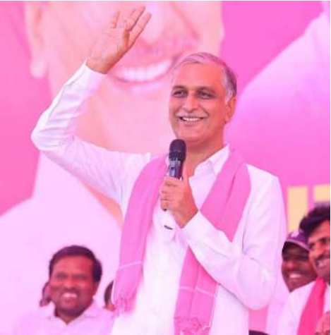
దాటుతున్నా రాని 2లక్షల ఉద్యోగాల కోసం, ఏ నెలకు ఆ నెలకు

నిర్బంధించి నల్లమల డిక్లరేషన్ ప్రకటించడమే ప్రజా పాలనా? ఎప్పుడీ లాగే రేవంత్ ప్రసంగంలో తెచ్చి పెట్టుకున్న అవేశం తప్ప, కంటెంట్ లేదు, కాంటెస్ట్ లేదు. అత్యస్తుతి పరనింద తప్ప, అక్కరకు వచ్చే ముచ్చట లేదు. అలవాటైన ఊకదంపుడు ప్రసంగాన్నే అదే పనిగా డంచాడు. తమ పరిపాలన ప్రయోజనాలను ప్రజలు పడే పడే గుర్తు చేసుకుంటున్నారని డబ్బా కొట్టుకున్నాడు. అవును రేవంత్ రెడ్డి...మీ అసమర్థ పాలనలో అమలు కాని హామీలను ప్రజలు పడే పడే గుర్తు చేసుకుంటున్నారు.. రుణమాఫీ ఎగ్గొట్టినందుకు, బ్యాంకుల చుట్టూ తిరుగుతూ బావురుమంటున్న రైతులు.. కల్లా దగ్గర పడిగావులు కాస్తా కన్నీరు పెట్టుకుంటున్న రైతులు.. వడగండ్లతో పంట నష్టపోయి గుండెలు బాదుకుంటున్న రైతులు మిమ్మల్నే గుర్తు చేసుకుంటున్నారు. మహాలక్ష్మి కింద నెల నెలా రావాల్సిన 2500 ఇంకా రావడం లేదని ఆడబిడ్డలు.. కల్వాల లక్ష్మి కింద రావాల్సిన తులం బంగారం కోసం ఆడబిల్ల తల్లిదండ్రులు.. మీరిస్తామన్న స్కూటీల కోసం ఆశగా ఎదురు చూస్తున్న యువతులు.. పడే పడే గుర్తు చేసుకుంటున్నారు. విద్యార్థిరోసా కింద ఇస్తామన్న 5లక్షల కార్డు కోసం విద్యార్థులు.. ఏడాదిలో ఇస్తామని చెప్పి ఏడాదినిగ