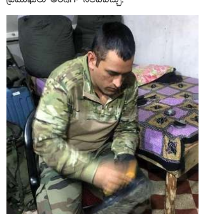
భారత్ పాకిస్థాన్ మధ్య తీవ్ర ఉద్రిక్తతలు నెలకొన్ని విషయం తెలిసిందే. ఒక రకంగా రెండు దేశాల మధ్య అనధికారిక యుద్ధం మొదలైందని నిపుణులు అంటున్నారు. పహల్గామ్ ఉగ్రదాడికి స్థవీకారంగా పాకిస్థాన్, పాకిస్థాన్ ఆక్రమిత కశ్మీర్లలోని ఉగ్ర స్థావరాలపై భారత్ ఆపరేషన్ సిందూర్ పేరిట దాదులు చేపట్టింది. దీనికి స్థవీకారంగా పాకిస్థాన్ జమ్మూ కశ్మీర్తో పాటు పలు ప్రాంతాలపై దాడికి యత్నించింది. కానీ, వాటిని భారత్ తప్పికొట్టింది. ఆ తర్వాత భారత్ పాక్ పై దాడి చేసినట్లు ఇప్పటి వరకు సమాచారం అందుతోంది. ఈ క్రమంలోనే సోషల్ మీడియాలో పలు వీడియోలు వైరల్ అవుతున్నాయి. వాటిలో 90 శాతం ఫేక్ వీడియోలు, ఏఐ జనరేటెడ్ వీడియోలు అంటూ కొంతమంది ఫ్యాక్ట్ చేసి నిరూపిస్తున్నారు.ఇలాంటి పరిస్థితుల్లో