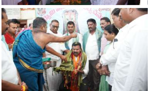
జరుగుతుందనే నమ్మకంతో (పజలు నిత్యం ఇక్కడికి వస్తుంటారని. భక్తుల రాకను దృష్టిలో పెట్టుకుని దేవాలయంలో సౌకర్యాలు మెరుగుపర్చాల్సిన అవసరం ఉందన్నారు. ఈ దిశగా తనవంతు కృషి చేస్తానన్నారు. అంతకు ముందుకు ఎమ్మెల్యే డాక్టర్ కవ్వంపల్లి