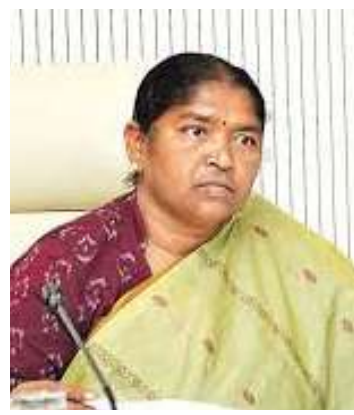
హైదరాబాద్,6(పిసిడబ్ల్యూ న్యూస్): గత

ప్రభుత్వం కొన్ని వర్గాలకే కొమ్ముకాని రాష్ట్రాన్ని అప్పుల కుప్పగా మార్చిందని మంత్రి సీతక్క విమర్శించారు. కేసీఆర్ అప్పు.. తెలంగాణ భవిష్యత్తుకు ముప్పుగా దాపురించిందన్నారు. కేసీఆర్ నిర్వాకం వల్ల నెలకు 6 వేల కోట్ల ప్రజాధనాన్ని అప్పుల చెల్లింపుల కోసం మళ్లించాల్సి వస్తోందని తెలిపారు. బీఆర్ఎస్ వర్కింగ్ ప్రెసిడెంట్, మాజీ మంత్రి కేటీఆర్ పై మంత్రి సీతక్క, ఎంపీ చామల కిరణ్ కుమార్ రెడ్డిలు ఆగ్రహం వ్యక్తం చేశారు. మంగళవారం వీరు మీడియాతో మాట్లాడుతూ.. సీఎం రేవంత్ రెడ్డిపై అనవసర వ్యాఖ్యలతో కేటీ ఆర్ తన అసహనాన్ని ప్రదర్శిస్తున్నారని మంత్రి సీతక్క మండిపడ్డారు. సత్తా ఉన్న నాయకుడు కేసీఆర్ అయితే.. పత్తా లేకుండా ఎక్కడికి వెళ్లారని ప్రశ్నించారు. సత్తా