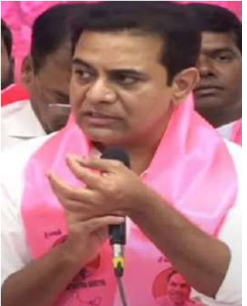
హైదరాబాద్,మే 6(పిసిడబ్ల్యూ న్యూస్):

తెలంగాణ రాజకీయ వేడి మరోసారి పెరిగింది. సిఎం రేవంత్ వ్యాఖ్యలపై దుమారం రేగుతోంది. ముఖ్యమంత్రి రేవంత్ రెడ్డిపై బీఆర్ఎస్ వర్కింగ్ ప్రెసిడెంట్ కేటీఆర్ తీవ్ర స్థాయిలో విమర్శలు చేశారు. వ్యక్తిగత దూషణలు, విమర్శలు వచ్చినా సహించామని, కానీ ఉద్యమంలో పాల్గొన్న ఉద్యోగ సంఘాల నేతలపై ముఖ్యమంత్రి చేసిన వ్యాఖ్యలు తట్టుకోలేక ఈ ప్రెసిడెంట్ ఏర్పాటు-చేయాలి వచ్చిందని ఆయన స్పష్టం చేశారు. తెలంగాణ సాధనలో విద్యార్థులు, ఉద్యోగ సంఘాల నాయకులు పార్టీలకతీతంగా పాల్గొన్నా వాస్తవాన్ని గుర్తుచేస్తూ, అలాంటి నేతలపై ముఖ్యమంత్రి చేసిన వ్యాఖ్యలు బాధాకరంగా ఉన్నాయని అన్నారు. రేవంత్ రెడ్డి మాట్లాడుతున్న తీరు ఆయన పాలనాపరమైన అనుభవ లేకపోయినదని సూచనగా