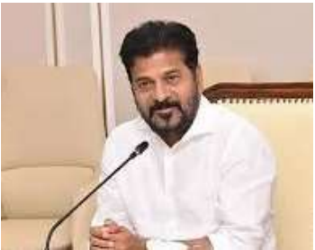
హైదరాబాద్,మే 6(పిసిడబ్ల్యూ న్యూస్): తెలంగాణలో రాబోయే 50 సంవత్సరాల అవసరాలను తీర్చడానికి తగినట్లుగా రీజనల్