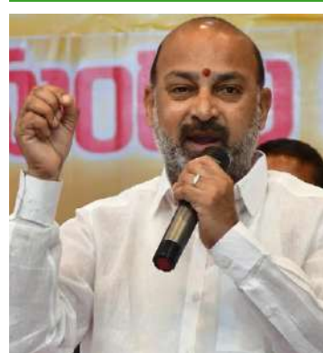
రాజన్నసిరిసిల్ల,6(పిసిడబ్ల్యూ న్యూస్): ఇచ్చిన హామీలను నెరవేర్చలేక కాంగ్రెస్ చేతులెత్తేసి ఉంటారన్నారు.సంవిధాన్ చూపిస్తూ రాహుల్ నేత, కేంద్ర మంత్రి బండి సంజయ్ తీవ్రంగా

ప్రభుత్వాన్ని నడిపే స్థితిలో లేని రేవంత్ ఆయన వ్యాఖ్యలే ఇందుకు నిదర్శనమన్న బండి