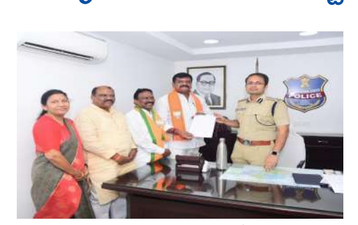
హనుమకొండ, మే 5 (పిసిదబ్హ్యూ న్యూస్):ఇటీవల జమ్మూ కాశ్మీర్ లో జరిగిన ఉగ్రవాదుల దాడి అనంతరం జరిగిన పరిణామాల నేపథ్యంలో పాకిస్థాన్ వారిని దేశం నుండి వెళ్ళిపోవాలని కేంద్ర