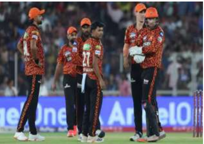
జట్టు తీవ్ర కష్టాల్లో ఉన్నప్పుడు టూర్లు చేసి, మైదానంలో దారుణ ప్రదర్శన కనబరిచేసే విమర్శలు వస్తాయి. సన్ రైజర్స్ హైదరాబాద్ ప్రస్తుతం అలాంటి విమర్శలనే ఎదుర్కొంటోంది. జట్టు కూర్చో బాగోలేదా? సన్ రైజర్స్ అటూర్లు ఎంజాయ్ మెంట్ ను పక్కనపెడితే జట్టు కూర్పు కూడా విమర్శలకు తావిస్తోంది.

పది మ్యాచ్ లలో మూడు ఓటములు.. పాయింట్ల పట్టికలో కింది నుంచి రెండో స్థానం.. రన్ రేట్ కూడా అత్యంత దారుణం.. ఛేజింగ్ లో దమ్ము లేదు.. మొదట బ్యాటింగ్ లో చార్జ్ లేదు.. నిరుడు మైదానంలో దిగితే 300 కొడతారనే హైప్.. ఈసారి కిందా మీద పడినా 200 కొట్టలేని దుస్థితి.. గెలిచిన మూడు మ్యాచ్ లు కూడా ఐలీసన్ జట్లపైనే.. ప్రస్తుత ఐపీఎల్ సీజన్ లో ఇదీ సన్ రైజర్స్ హైదరాబాద్ పరిస్థితి. నిరుడు రన్సురమ్ జట్టు ఇదేనా? అనే డౌట్. గ్రౌండ్ లో ప్రదర్శన అలా ఉంటే.. గ్రౌండ్ బయట..? ఏప్రిల్ 25న చెన్నై సూపర్ కింగ్స్ తో మ్యాచ్ లో గెలిచాక ఇక ఐపీఎల్ టైటిల్ సాధించామని అనుకున్నారేమో..? సన్ రైజర్స్ జట్టును మాల్దీవ్స్ టూర్ కు పంపారు. అక్కడ టీవీ లలో అటూర్లు ఎంజాయ్ చేశారు. తీరా శుక్రవారం గుజరాత్ తో మ్యాచ్ లో చూస్తే దారుణంగా ఓడిపోయారు. దీనికీముందు హైదరాబాద్ లో పల్ లోలో తిరుగుతూ కనిపించారు సన్ రైజర్స్ అటూర్లు. విహారం, విహారం, విందులను ఎవరూ కాదనరు.. ఎప్పుడూ క్రికెట్ అనే పరిస్థితి నుంచి రిలాక్స్ కోసం ఇలాంటివి ఉండాలిందే. కానీ,