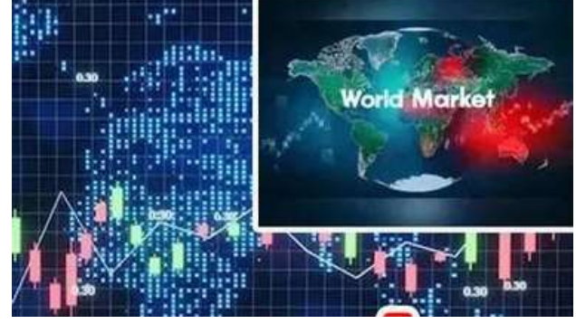
భారత స్టాక్ మార్కెట్లు రేపటి వారం అత్యంత ఒడిదుదుకులతో ఉందే అవకాశం కనిపిస్తోంది.

అమెరికా తెచ్చిన పూర్తి స్థాయి వాణిజ్య యుద్ధం.. ప్రపంచ వాణిజ్యాన్ని, తద్వారా ఆయా దేశాల ఆర్థిక పృద్ధిని ప్రభావితం చేస్తుందని, దీనికి తోదు అమెరికా ఆర్థిక మాంద్య భయాలతో పెట్టుబడిదారులు భయపదుతున్నారని మార్కెట్ నిపుణులు అభ్కిపాయపదుతున్నారు. ఇదిలా ఉంటే, వచ్చే వారం వడ్డీ రేటు నిర్ణయం వెలువడుతుండటం, ఈ వారంలో భారతదేశ పారిశ్రామిక, ఉత్పత్తి డేటా కూడా విడుదల కానుంది. అటు, అమెరికా ద్రహ్యోల్బణ డేటా వస్తుందటం వల్ల స్టాక్ మార్కెట్లు అస్థిర పోకడలను ఎదుర్కోవచ్చని (టేడ్ పండితులు లెక్కలు కదుతున్నారు. అమెరికా సుంకాలు, డ్రవంచ ఆర్థిక వ్యవస్థ, ద్రవ్యోల్పణంపై విస్తృత ప్రభావాలను పెట్టబడిదారులు అంచనా వేస్తున్నారని విశ్లేషకులు అంటున్నారు.మరోవైపు, చైనా యొక్క మార్చి నెల కన్స్టూమర్ (పైస్ ఇండెక్స్ డేటా గురువారం విడుదల కానుంది. యూకే డేటా శుక్రవారం విడుదల కానుంది. ఇక, ఏట్రిల్ 10న ఫలితాలతో ఇన్ కం సీజన్ ప్రారంభమవుతుంది. ఈ వారం అమెరికా, భారతదేశం నుండి వెలువడే మార్చి డేటాపై కూడా పెట్టుబడిదారులు దృష్టి సారిస్తారని చెబుతున్నారు.దీనికి తోదు ఈ వారం విదేశీ పెట్టుబడిదారుల వాణిజ్య కార్యకలాపాలు, రూపాయి–డాలర్ ధోరణి, క్రూడ్ ఆయిల్ ధరలను మార్కెట్లు ఆసక్తిగా పరిశీలిస్తాయని నిపుణులు తెలిపారు.