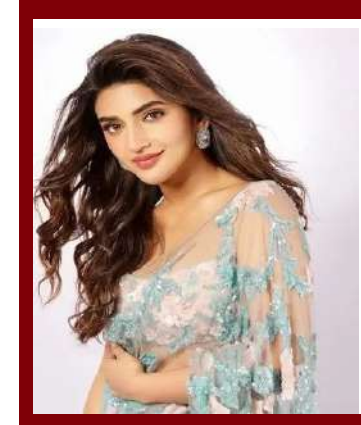
<del>క్ర</del>ీలీలను లాక్కుపాయాడు. ఇది• క చేదు అనుభవం

భయపడుతున్నారని వ్యాఖ్యానించారు. అసలు ప్రయత్నమే చేయకుండా అవకాశాలు రావడం లేదంటే అది ఎంతవరకు కరెక్ట్.. ఓపికతో (ప్రయత్నిస్తేనే కదా అవకా శాలు వస్తాయో లేదో తెలిసేదని చెప్పుకొచ్చారు. అందుకు ఉదాహరణ తానే అని కొత్తగా వచ్చే వారికి ఇచ్చే సలహా కూడా ఒకటే అని.. అవకాశాలు రావు అని భయపదే బదులు గట్టిగా ప్రయత్నిస్తే, అవే అవకాశాలు మీ ఇంటి తలుపు శదతాయి అంటూ వెల్లడించారు.అలాంటి ప్యాత చేయాలని ఉంది..ఇంకా లానే మాట్లాదుతూ అలియా భట్ నటించిన గంగూభాయి కతియావాడి సినిమా తనకు చాలా ఇష్టం అని వెల్లడించింది. అలియా భట్ నటనకు ఫిదా అయిపోయానని.. ఆ పాత్రకు ఆమె ప్రాణం పోసిందని భవిష్యత్తులో తనకు కూడా అలాంటి పాత్రలు చేయాలని ఎంతో ఆశగా ఉందన్నారు.మరోవైపు కొద్ది రోజుల క్రితం ఎస్కేఎన్ మాట్లాడుతూ.. తెలుగులో తెలుగు ವೆವ್ಪಿನ မಮ್ಮಾಯಲ ಕಂಟೆ ತಲುಗು ರಾನಿ ಅಮ್ಮಾಯಿಲ್ಸೆ ఎక్కువగా (పేమిస్తుంటారు.. తెలుగమ్మాయిల్ని ఎంకరేజ్ \frac{1}{2} ఏం జరుగుద్గో మాకు తెలిసి వచ్చింది. అందుకే ఇకపై తెలుగు రాని అమ్మాయిల్నే సపోర్ట్ చేయాలని నేను, సాయి రాజేష్ ఫిక్స్ అయ్యాం అంటూ ఎస్కేకేఎస్ వ్యాఖ్యానించారు.