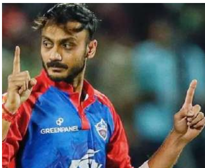
ఇంటర్వ్యూ: త్వరలో ఐపీఎల్ మోగా వేలం జరుగనున్న

నేపథ్యంలో ఢిల్లీ క్యాపిటల్స్ కీలక నిర్ణయం తీసుకుంది. తమ జట్టుకు సారథిగా ఛాంపియన్స్ ట్రోఫీ హీరో అక్షర్ పటేల్ ను ఎంపి చేసింది. వచ్చే మోగా ఆక్షర్ లో అతడిని రిటెయిన్ చేసుకునేందుకు సిద్ధమైంది 2019 నుంచి అక్షర్ పటేల్ డీసీ జట్టుతో కొనసాగుతున్నాడు. నాయకత్వంలో పెద్దగా అనుభవం లేకపోయినప్పటికీ జనవరిలో అతడిని వైస్ కెప్టెన్ గా ఎంపిక చేసింది.గుజరాత్ కు చెందిన అక్షర్ మాధుడు ఫార్మాట్ లో 23 మ్యాచుల వరకూ ఆడాడు. ఇదీవల సయ్యర్ ముస్తాక్ అలీ ట్రోఫీ, విజయ్ హజారే ట్రోఫీలో కూడా పాల్గొన్నాడు. గతేడాది ఓ మ్యాచ్ లో డీసీకి సారథిగా వ్యవహరించాడన్నది. అయితే, డీసీ కచ్చితంగా గెలవాల్సిన ఆ మ్యాచ్ లో ఓటమి చవిచూడాల్సి వచ్చింది. దీంతో, షేఆఫ్ ఘోస్ చరేలేకపోయింది.నేటి నుంచి వైజాగ్ ఐపీఎల్ డిక్టేట్ విక్రయంవంతే నిప్రముఖ తరువాత మరో సారథి కోసం డీసీ ప్రయత్నాలు ప్రారంభించింది. కేవల్ రాహుల్ కు కెప్టెన్ పదవి ఇవ్వచ్చన్న అంచనాతో అతడికి డీసీ