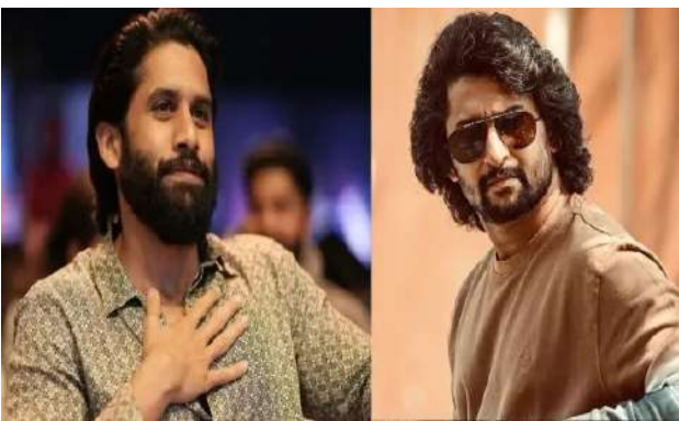
మల్టీస్టార్ చేసినా బ్లాక్ బస్టర్ అవడం ఖాయమని సినీ విశ్లేషకులు చెబుతుంటారు. అలాగే నాగచైతన్య-నాని కాంబినేషన్ లో రావాల్సిన ఓ సినిమా మిన్ అయింది.