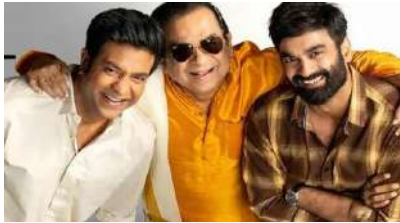
టాలీవుడ్ కి కామెడీ కింగ్ బ్రహ్మానందం దాదాపు నాలుగు దశాబ్దాలుగా వెండితెరపై తనదైన శైలి నటనతో ఆకట్టుకున్న ఆయన ఈమధ్యన సినిమాలు చేయడం తగ్గించారు. చాలా

సెలెక్టివ్గా, నటనకు ఆస్కారం ఉన్న పాత్రలు మాత్రమే చేస్తున్నారు. అలా చేసిన చిత్రమే ‘బ్రహ్మ ఆనందం’. బ్రహ్మానందం, ఆయన తనయుడు రాజా గౌతమ్ కలిసి నటించడం, ట్రైలర్లు, థీజర్లు ఆకట్టుకోవడంతో సినిమాకు మంచి బజ్ ఏర్పడింది. శ్రీ రిలీజ్ ఈవెంట్ కు చిరంజీవి అతిథిగా వచ్చి సినిమా గురించి మాట్లాడటంతో మరింత హైప్ పెరిగింది. ఈ శుక్రవారం ప్రేక్షకుల ముందుకొచ్చిన ఈ చిత్రం ఏ మేరకు మెప్పించింది? రాజా గౌతమ్ కు హీరోగా కమీబ్యాక్ ఇచ్చిందా? అన్నది చూద్దాం. కథ:బ్రహ్మానందం(రాజా గౌతమ్) ఓ థియేటర్ ఆర్టిస్ట్. చిన్నప్పటి తల్లిదండ్రులను కోల్పోతాడు. తాత మూర్తి (బ్రహ్మానందం), కుటుంబ సభ్యులు, స్నేహితులు కూడా దగ్గర లేకపోవడంతో నాకు నేనే అన్నట్లు స్వేచ్ఛంగా