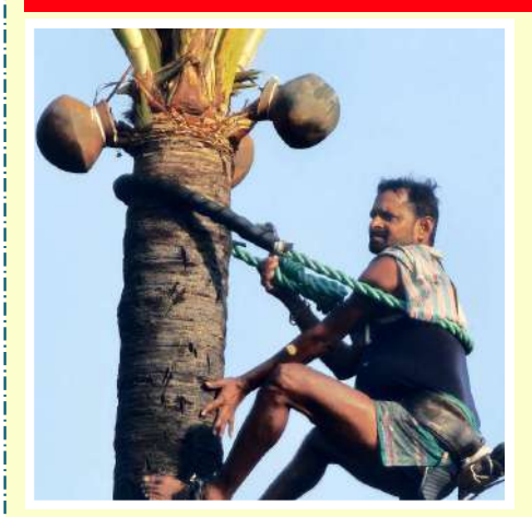
పరకాల, ఫిట్రవరి 6 (పిసిడబ్లూ న్యూస్): గ్రామాల్లో ఉన్నవారు తాటికల్లుని దివ్య ఔషధంగా భావిస్తారు. ఎందుకంటే ఇందులో విటమిన్ను, ఖనిజ లవణాలు సమృద్దిగా ఉంటాయి. ఇవి

ఆరోగ్యానికి చాలా మేలు చేస్తాయి. అందుకే పూర్వీకులు తాటిచెట్టుని కల్పవృక్షంగా భావించేవారు. (పతి ఆరోగ్య సమస్యకి కల్లు ద్వారానే పరిష్కారం వెతుక్కునేవారు. కల్లు ఆరోగ్యానికి మేలు చేస్తుందని ఎన్నో పరిశోధనల్లో తేలింది. కానీ ఏదైనా అతిగా సేవిస్తే ప్రమాదమే ఈ షరతు తాటికల్లుకి కూడా వర్తిస్తుంది. అయితే తాటికల్లుని ఎప్పుడు తాగాలి. ఏ సమయంలో తాగితే మంచిదో అనేక విషయాలు తెలుసుకుందాం.. అప్పుడే చెట్టు నుంచి తీసిన తాటికల్లు తాగితే అందులో ఉన్న ఓ సూక్ష్మజీవి మానవుని కడుపులో ఉన్న క్యాన్సర్ కారకాన్ని నాశనం చేస్తుందని ఆయుర్వేద నిపుణులు సూచిస్తున్నారు. చెట్ట నుంచి తీయగానే తాగితే ఈ ఫలితాలు అందుతాయి. కొన్ని గంటలు తర్వాత తాగితే అది పులిసిపోయి ఆల్క్హోల్గా మారిపోతుంది. దాన్ని తాగితే ఆరోగ్యానికి హానికరం. అందుచేత చెట్టు నుంచి తీసిన కల్లనే తాగాలని ఆయుర్వేద నిపుణులు చెబుతారు. తాటికల్లు మానవ ఆరోగ్యానికి ఎంతో మేలు చేస్తుంది. డయేరియా, టైఫాయిడ్ వంటి వ్యాధులకు కారణం అయ్యే వైరస్కు తాటికల్లు యాంటిబయాటిక్గా పనిచేస్తుండనేది అక్షర సత్యం. నగరాలు, పట్టణాలలో నివసించే ప్రజలు ప్రతిరోజు మసాల ఆహారాలు, జంక్ ఫుడ్స్ వంటివి తీసుకుంటారు. దీంతో