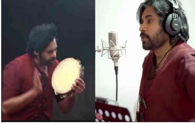
గుల్లామ్ ఏం గురాయింది చూస్తున్న భయపెట్టనీకా..?