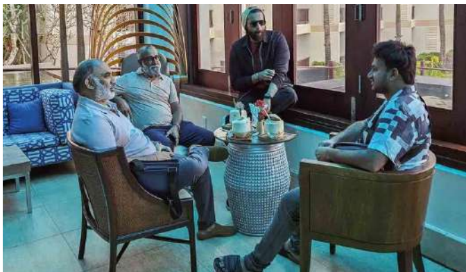
మొదటి వారం నుంచి రెగ్యులర్ షూటింగ్ షురూ కానుందని ఇన్ సైడ్ టాక్.