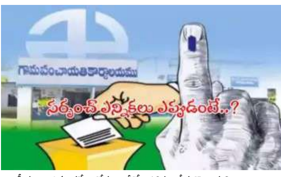
రాజకీయ, ఆర్థిక సర్వే కోసం జీవో 18ను తీసుకొచ్చామని ఎన్నికలకు సర్కార్ గ్రీన్ సిగ్నల్ ఇస్తుందని భావిస్తున్నారు.

హైదరాబాద్, అక్టోబర్ 13(పీసీడబ్ల్యూ న్యూస్): తెలంగాణలో స్థానిక సంస్థల ఎన్నికలు ఎప్పుడు అనే దానిపై బీసీ సంక్షేమ శాఖ మంత్రి పొన్నం ప్రభాకర్ క్షారిటీ ఇచ్చారు. తెలంగాణలో స్థానిక సంస్థల పదవీ కాలం పూర్తి అయ్యింది. 2019 జనవరిలో గ్రామ పంచాయతీలకు, అదే ఏడాది మే నెలలో జిల్లా పరిషత్, మండల పరిషత్లకు ఎన్నికలు జరిగాయి. స్థానిక సంస్థల ప్రజా ప్రతినిధుల పదవీ కాలం పూర్తి కావడంతో, ఎన్నికలు ఎప్పుడు నిర్వహిస్తారనే దానిపై రాజకీయ వర్గాల్లో చర్చ జరుగుతోంది. ఈ తరుణంలో మంత్రి పొన్నం ప్రభాకర్.. స్థానిక సంస్థల ఎన్నికలు ఎప్పుడు అనే దానిపై ఒక క్షారిటీ ఇచ్చారు. సిద్దిపేట జిల్లా హుస్సాబాద్ లో మంత్రి పొన్నం ప్రభాకర్ శనివారం దసరా పండుగ సందర్భంగా ఎల్లమ్మ తల్లి ఆలయంలో పూజలు నిర్వహించారు. అనంతరం మంత్రి మీడియాతో మాట్లాడుతూ .. రాష్ట్రంలో సామాజిక,