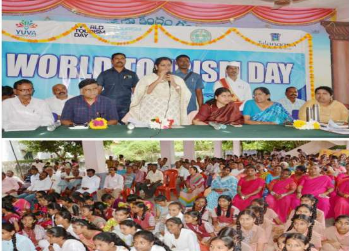
World Tourism Day event with children and officials.