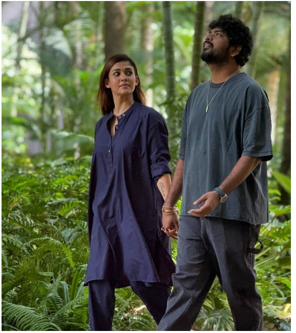
తిహాసన్, సాబిన్ షాహిర్ కీలకపాత్రలు పోషిస్తున్నారు. అనిరుద్ స్వరాలు సమకూ రుస్తున్నారు. ప్రస్తుతం విశాఖపట్నంలో కీలక సన్నివేశాల్ని తెరకెక్కిస్తున్నారు.