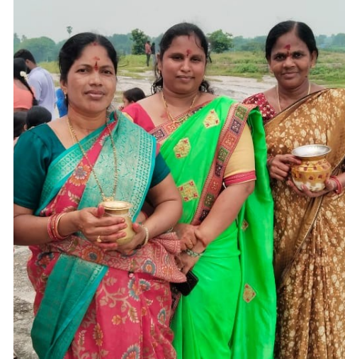
రంగాల్లో పురుషులతో సమానంగా వారి సామర్థ్యాన్ని నిరూపించుకోగలరు. మహిళలు పురుషులతో పాటు సమాన స్థాయి చేరుకోవడానికి ప్రధాన కారణం వారికి విద్యను ఇతర అవకాశాలను పురుషులతో సమానంగా అందించకోవడమే.

అవకాశాల్లో సగం అన్న మహిళా సాధికారిక నినాదం ఆచరణలో అమలుకు నోచుకోవడం లేదు. అన్ని రంగాల్లో రాణిస్తున్న మహిళలు రాజ్యాంగం కల్పించిన రిజర్వేషన్లు మాత్రం అనుభవించలేకపో తున్నారు. సర్పంచు, ఎంపీటీసీ, ఎంపీసీ, జడ్పీటీసీ, కౌన్సిలర్, మున్సిపల్ చైర్మన్ గా పొందిన వారంతా మన ప్రాంతాలను ప్రగతి పథంలో నడిపిస్తామని ప్రతిజ్ఞ అయితే చేశారు. కానీ అదుగు ముందుకు వేయడం లేదు వారి స్థానంలో భర్తలు, కుమారులు, ఇతర కుటుంబీకులు పెత్తనం చెలాయిస్తున్నారు. కేవలం సమావేశాలకి హాజరై సంతకాలు చేయడానికి 90 శాతం మహిళా ప్రజాప్రతినిధులు పరిమితం అవుతున్నారు. వారికి ప్రభుత్వం కల్పించిన హక్కులను వినయోగించుకునే స్వేచ్ఛ ఇచ్చినప్పటికీ మహిళా సాధికారత సాధ్యమవుతుంది. ఆలోచన ధోరణిలో మార్పు రావాలి.. ఒకప్పుడు పురుషులు మాత్రమే చేయగల లు అనుకుని అనేక పనులను ఇప్పుడు మహిళలు కూడా చేసి చూపిస్తున్నారు. అంతేకాదు వారిని మించిపోతున్నారు కూడా ఒకవైపు ఉద్యోగంతో సతమతమవుతూ ఇంటి బాధ్యతలు నిర్వహిస్తూ ముందుకు దూసుకెళ్తున్నారు. మహిళలను అన్ని విధాలుగా ప్రోత్సహిస్తూ సామాజిక అభివృద్ధి కూడా ఎక్కువ సాధ్యమవుతుంది. ఒక సాధారణ మహిళ సామర్థ్యం ఒక సాధారణ పురుషుని మేధో సామర్థ్యం కంటే ఎక్కువ అని పరిశోధనలు రుజువు చేశాయి మహిళలకు సరైన అవకాశాలు ఇచ్చి సట్టుతే వారు అన్ని