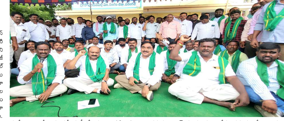
చూస్తే 7500 కోట్లు మాత్రమే మాఫీ చేశారని, ఇక్కడే లెక్క అని మండిపడ్డారు. రుణమాఫీ పూర్తిగా చేశామని రేవంత్ రెడ్డి ప్రకటనలు చేస్తున్నారని, మరోవైపు ఆర్థిక మంత్రి ఇంకా చేయలేదు, చేస్తున్నామని మాట్లాడుతున్నారని, ఖమ్మంలో మరో మంత్రి 30 శాతం మందికి ఇచ్చామని, ఇంకా చేస్తామంటున్నారని, మాఫీ లెక్కలపై ప్రభుత్వానికి కార్పిటీ లేకపోతే ఎలా అని ప్రశ్నించారు. కాంగ్రెస్ మోసాన్ని ప్రజల్లోకి తీసుకెళ్లి చైతన్యపంథం చేసేందుకు ఈ కార్యక్రమం చేపట్టినట్లు స్పష్టం చేశారు. బీఆర్ఎస్ పాలనలో సీజన్ ప్రారంభంలో రోజూ కార్యక్రమం రైతులకు రైతుబంధు అందిస్తే,