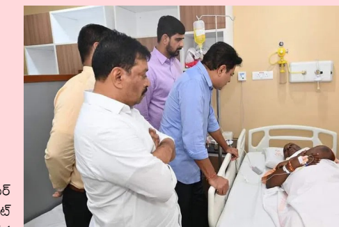
హైదరాబాద్ లోని యశోద ఆసుపత్రిలో చికిత్స పొందుతున్నారు.