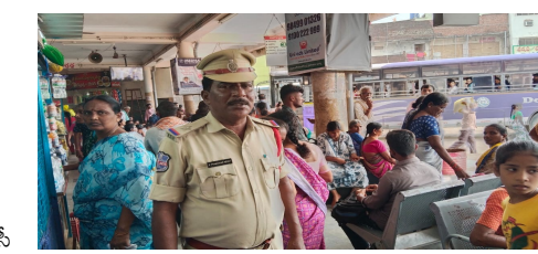
తొర్రూరు టీజీఎస్ ఆర్టీసీ బస్టాండ్ లో సీసీ కెమెరాలు లేకపోవడం గా ఇదే అదరంగా భావించిన దొంగలు దొంగతనాలు చేస్తూనే ఉన్నారు. సీసీ కెమెరాల ఏర్పాటు లేకపోవడంతో పోలీసులకు కూడా దొంగలను పట్టుకోవడం కష్టతరంగా మారిందని అంటున్నారు. గతాన్ని పరిశీలిస్తే తొర్రూరు బస్టాండ్ ఆవరణలో అనేక మంది నెల్ ఫోన్స్, నాలుగు తులాల బంగారం, మహిళల పరుసులు, విలువైన వస్తువులు పోతూనే ఉన్నాయి. శనివారం రోజున చేతిపరుకులు పోయాయని పోలీసులకు ఫిర్యాదు చేయగా

తొర్రూరు ప్రతినిధి, ఆగస్టు 24 (పీసీడబ్ల్యూ న్యూస్): ఆర్టీసీ బస్టాండ్ లో రైల్వే స్టేషన్ లు, రద్దీగా ఉండే ప్రదేశాలలో జేబు దొంగలు సర్వసాధారణంగానే ఉంటారు. ఎన్ని మార్లు మైకులలో ప్రచారం చేసినప్పటికీ ప్రయాణికుల ఆత్రుతలను గమనించి దొంగతనాలు చేసేవారు వారి నైపుణ్యంతో మహిళల మెడలోని గొలుసులను పర్చు, విలువైన వస్తువులను దొంగిలిస్తూనే ఉన్నారు. తెలంగాణ రాష్ట్ర ప్రభుత్వం మహిళలకు ఉచిత బస్సు సర్వీస్ ఏర్పాటు చేసిన దగ్గర నుండి రద్దీగా ఉండే బస్టాండ్ ప్రాంతంలో అదనం చూసి దొంగలు రెచ్చిపోతున్నారు. మహబూబాబాద్ జిల్లా