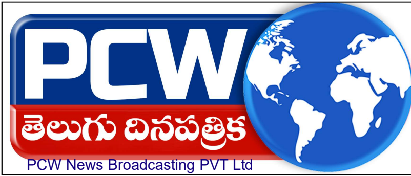
PCW News Broadcasting PVT Ltd