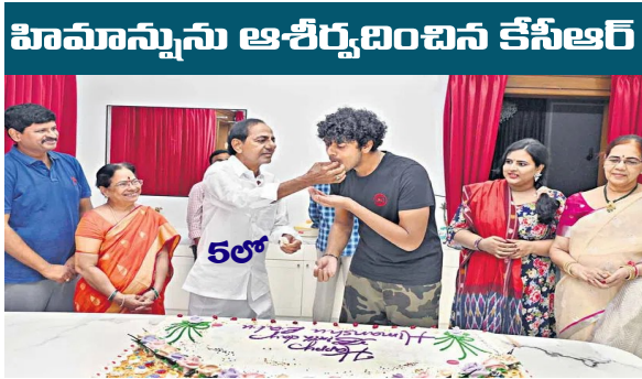
హిమాన్నును ఆశీర్వాదించిన కేసీఆర్