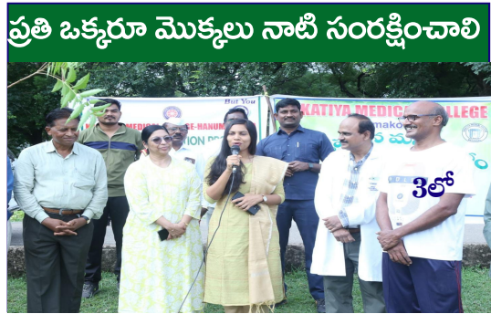
ప్రతి ఒక్కరూ మొక్కలు నాటి సంరక్షించాలి

Published from Hyderabad, circulated to:Hyderabad, Nalgonda, Khammam, Rangareddy, Sangareddy, Warangal, Mbnr, Kurnool, Kadapa, Amaravathi,Krishna