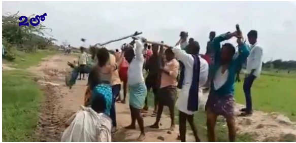
ఉమ్మడి ధర్మ కౌట చంపిన ఘటనపై సీరియస్.. ఎస్సె సీనియర్