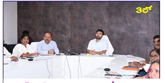
పండింగ్ ధర్మ దరఖాస్తులను సత్వరమే పరిష్కరించాలి

Published from Hyderabad, circulated to:Hyderabad, Nalgonda, Khammam, Rangareddy, Sangareddy, Warangal, Mbnr, Kurnool, Kadapa, Amaravathi,Krishna