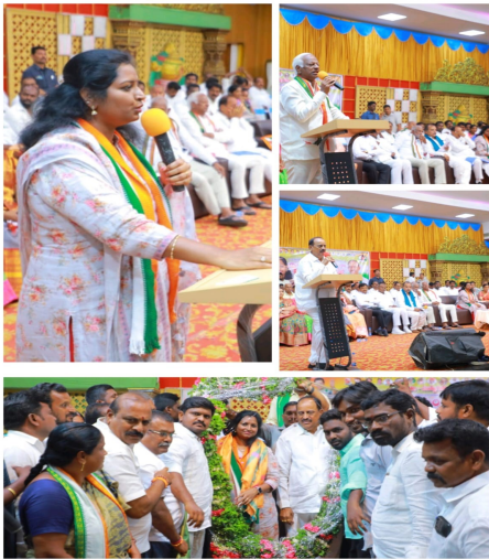
పతనం మొదలైంది. రానున్న రోజుల్లో కాంగ్రెస్ పార్టీ గట్టి పునాదిని నిర్మించే బాధ్యత మనందరి పైన ఉంది. పరకాల