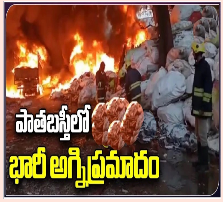
పాతబస్తీలో భారీ అగ్గిప్రమాదం

హైదరాబాద్, జూన్ 12 (పిసిడబ్ల్యూ న్యూస్): పాతబస్తీ పురాని హాటెల్లోని ఎస్కే ఫుట్వేర్ షాపులో బుధవారం సాయంత్రం భారీ అగ్గిప్రమాదం సంభవించింది. విద్యుత్ షాక్ కారణంగా ఈ ప్రమాదం జరిగినట్లు తెలుస్తుంది. ఈ ప్రమాదంలో సుమారు రూ. 50 లక్షల విలువైన ఆస్తి నష్టం జరిగింది. చెప్పులు, ముడి సరుకు పూర్తిగా కాలి బూడిదైంది. ఘటనాస్థలానికి చేరుకున్న పోలీసులు, అగ్గిమాపక సిబ్బంది కలిసి మంటలను అదుపు చేశారు. చెప్పుల దుకాణం కావడంతో మంటలు క్షణాల్లో వ్యాపించాయి. దట్టమైన పొగలు కమ్ముకున్నాయి. దీంతో స్థానికులు తీవ్ర భయాందోళనకు గురయ్యారు.