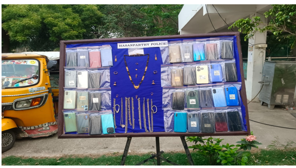
హసన్ పర్తి, మే 26 (పిసిదబ్బు న్యూస్): వరంగల్ పోలీస్ కమిషనరేట్ కాజీపేట్ సబ్ డివిజన్ హసన్ పర్తి, ఎల్మతుర్తి పోలీసు