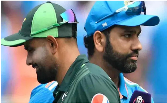
మ్యాచ్ ఫీల్డ్: ఇండియా, పాకిస్థాన్ క్రికెట్ మ్యాచ్ అంటేనే హైవోల్టేజ్ గేమ్. ఇక ఆ మ్యాచ్ ను ప్రత్యక్షంగా వీక్షించేందుకు క్రికెట్ అభిమానులు ఎగబడుతుంటారు. నిజానికి ఈ రెండు దేశాల మధ్య ప్రస్తుతం డ్రైపాక్షిక సిరిస్ లు లేవు. కానీ

అప్పుడప్పుడు ఈ రెండు జట్లూ.. టోర్నీల్లో తలపడుతుంటారు. అయితే వచ్చే నెలలో అమెరికాలో జరగనున్న టీ 20 వరల్డ్ కప్ లో దాయది సమరం జరగనున్నది. జూన్ 9వ తేదీన జరగనున్న ఈ మ్యాచ్ కు ఫుల్ క్రేజీ ఉంది. ఇక ఆ మ్యాచ్ టికెట్లను భారీ ధరకు అమ్మేస్తున్నారు. ఒక్కొక్క టికెట్ ను 20 వేల డాలర్లు అంటే సుమారు 17 లక్షలకు ఒక టికెట్ ను అమ్ముతున్నట్లు తెలుస్తోంది. అధిక ధరలకు టికెట్లను అమ్ముడాన్ని ఖండిస్తూ ఐపీఎల్ మాజీ చైర్మన్ లలిత్ మోదీ తన ఎక్స్ అకౌంట్ లో ఓ పోస్టు చేశారు. న్యూయార్క్ లోని నాసా కొంటీ ఇంటర్నేషనల్ క్రికెట్ స్టేడియంలో జరగనున్న మ్యాచ్ కు భారీ ధరకు టికెట్లు అమ్ముతున్నారని, క్రికెట్ ఆటను ప్రోత్సహిస్తున్నారా లేక ఆ క్రీడను అడ్డుకుంటున్నారా అని లలిత్ మోదీ ప్రశ్నించారు. డైమండ్ క్రబ్ కు చెందిన టికెట్లను 20 వేల డాలర్లకు అమ్మడం షాకి కు గురిచేస్తోందన్నారు. క్రికెట్ ను ప్రోత్సహించాలన్న ఉద్దేశంతో అమెరికాలో వరల్డ్ కప్ ను నిర్వహిస్తున్నారని, కానీ లాభాలు ఆర్జించేందుకు కాదు అని లలిత్ మోదీ తెలిపారు. అనేక వెబ్ సైట్లు క్రికెట్ మ్యాచ్ లకు చెందిన టికెట్లను భాక్ మార్కెట్ లో అమ్ముకుంటున్నట్లు ఆరోపణలు వచ్చాయి. ఈ అంశంపై ఇప్పటి వరకు ఐసీసీ అధికారికంగా స్పందించలేదు.