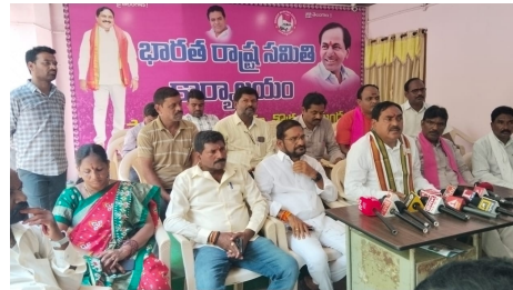
తోపాటు మరీకొందరు ప్రముఖులు తొర్రూకు రానున్నారని అన్నారు. ఈ కార్యక్రమంలో తొర్రూ మండల జెడ్పీసీ, ఎంపీపీ, బిఆర్ఎస్ పార్టీ నాయకులు పాల్గొన్నారు.

విలేకరుల సమావేశంలో వెల్లడించారు. రైతులు కష్టపడి పండించిన పంటను సకాలంలో ప్రభుత్వం కొనుగోలు చేయక అకాల వర్షాలకు తడిసి ముద్దవుతున్న ధాన్యాన్ని చూసి రైతులు ఆరుకాలం కష్టించి పండించిన వడ్డను ప్రైవేటు వ్యాపారస్తులకు అమ్ముకోవాల్సి పరిస్థితి ఏర్పడుతుందని ఆవేదన వ్యక్తం చేస్తున్నారు అని అన్నారు. ఈనెల 27వ తేదీ ఎమ్మెల్సీ ఎన్నికల తర్వాత రైతుల పక్షాన నిలబడతామని రైతులంతా ఏకం కండి మీ వెంటా మేముంటాం అని రైతులకు భరోసా ఇస్తున్నారని, 27వ తేదీ జరుగనున్న ఎమ్మెల్సీ ఉప ఎన్నికల్లో విద్యావంతులందరూ బిఆర్ఎస్ కి పోటీ చేస్తున్న విద్యావంతులను గెలిపించాలని కోరారు. 23వ తేదీ గురువారం తొర్రూ పట్టణం కి మాజీ మంత్రి తన్నీరు హరీష్ రావు, బిఆర్ఎస్ నుండి ఎమ్మెల్సీ ఎన్నికల్లో పోటీ చేస్తున్న అభ్యర్థి