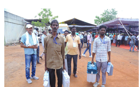
తమ విలువైన ఓటు హక్కును వినియోగించుకోవాలని కోరారు.

ంగా ఎస్పీ మాట్లాడుతూ పార్లమెంట్ ఎన్నికలను నిష్పక్షపాతంగా శాంతియుతంగా జరిగేలా భద్రతాపరంగా అన్ని చర్యలు తీసుకున్నామని ప్రతి పోలింగ్ స్టేషన్లో ఒక పోలీసు అధికారి ఉంటారని ఏటువంటి సమస్య ఎదురైనా వెంటనే స్పందించే లాగున పెద్ద సంఖ్యలో రూట్ మొబైల్ పార్టీలను నియమించడం జరిగినదని సెక్టార్ ఇన్చార్జిలనే కాకుండా ఒక్కో ప్రాంతానికి డీఎస్బీ స్థాయి అధికారులను నియమించినట్లు తెలియజేశారు.అలాగే మావోయిస్టు ప్రభావిత పోలింగ్ కేంద్రాలలో భారీ మొత్తంలో కేంద్ర ఆర్మూడ్ బలగాలు స్పెషల్ పార్టీ పోలీసుల ద్వారా భారీ భద్రత విధించామని ఎన్నికలకు ఆటంకం కలగకుండా ఇప్పటికే అన్ని చర్యలు తీసుకున్నామని ఎవరికి భయపడకుండా (ప్రజలందరూ