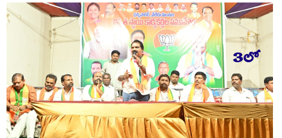
ఆదిలాబాద్ సమీక్షలో జిజిఎల్లో చేరిన పలువురు కార్యకర్తలు