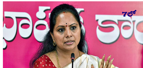
కవిత మధ్యంతర బెయిల్ పిటిషన్

Published from Hyderabad, circulated to:Hyderabad, Nalgonda, Khammam, Rangareddy, Sangareddy, Warangal, Mbnr, Kurnool, Kadapa, Amaravathi,Krishna