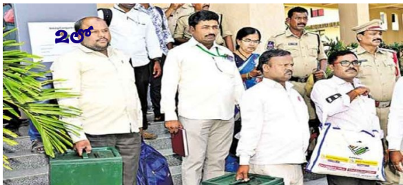
మహబూబ్ నగర్ ఎమ్మెల్యే ఓట్ల లెక్కింపు వాయిదా