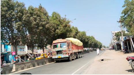
కనిపించకపోవడంతో ప్రమాదాలకు గురికావాల్సి వస్తుందని

తొర్రూర్, ఏప్రిల్ 1(పిసిడబ్ల్యూ న్యూస్): అధికారులకు ప్రజలంటే ఇంత చిన్నచూపు ఎందుకని పట్టణ వాసులే కాకుండా సుదూర ప్రాంతాల నుంచి వచ్చే వాహనదారులు కూడా అధికారుల పనితీరుపై మండి పడుతున్నారు. రోడ్లపై చెత్తారెదారం పేరుకు పోతున్న దృశ్యాలను చూసి చూడనట్లుగా వదిలేస్తున్నప్పటికీ ప్రతినిత్యం ప్రయాణించే రహదారులు మాత్రం రాత్రి వేళలో చిమ్మ చీకట్లు కమ్మి ఎదురుగా నిలబడి ఉన్న వాహనాలు