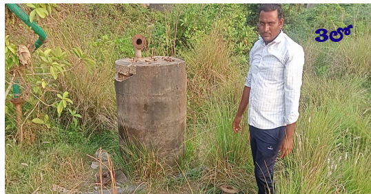
వ్యవసాయ మోటార్లను ధ్వంసం చేసిన దొంగలు..!

Published from Hyderabad, circulated to:Hyderabad, Nalgonda, Khammam, Rangareddy, Sangareddy, Warangal, Mbnr, Kurnool, Kadapa, Amaravathi,Krishna