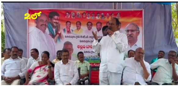
పార్లమెంట్ ఎన్నికలలో కాంగ్రెస్ జెండాను ఎగురవేస్తాం