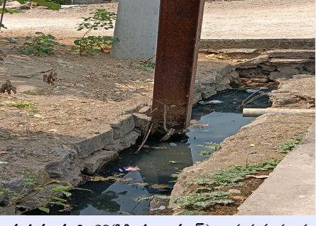
రామడుగు, మార్చి 29 (పీసీ డబ్ల్యూ న్యూస్): రామడుగు మండల కేంద్రంలో మూడో వార్డులో పడిపోయే స్థితిలో ఉన్న కరెంటు విద్యుత్ స్తంభం సంవత్సరం క్రితం ప్రమాదంగా ఉన్నదని గుర్తించిన విద్యుత్ సిబ్బంది దాని స్థానంలో మరో స్తంభాన్ని ఏర్పాటు చేశారు కానీ దానికి కనెక్షన్ ఇవ్వడం మరిచిపోయి నారు. ఇనుప స్తంభం తుప్పు పట్టి పడిపోయే స్థితిలో ఉన్న విద్యుత్ అధికారులు మాత్రం ఇటు వైపు కన్నెత్తి చూడడం లేదని కాలనీవాసుల ఆగ్రహం వ్యక్తం చేస్తున్నారు. విద్యుత్ సిబ్బంది దాని స్థానంలో మరో స్తంభాన్ని ఏర్పాటు చేశారు కానీ దానికి కనెక్షన్ ఇస్తే బాగుంటుందని అంటున్నారు.