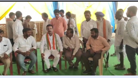
మరిపెడ, మార్చి 29 (పీసీడబ్ల్యూ న్యూస్): నియోజకవర్గంలో ఎక్కడైనా తాగునీటి ఎద్దడి నెలకొంటే, వెంటనే పరిష్కరించాలని డోర్లకల్ ఎమ్మెల్యే, ప్రభుత్వ విప్ డాక్టర్ జాబోత్ రామచంద్ర నాయక్ అధికారులను ఆదేశించారు. శుక్రవారం మరిపెడలో ఆయన విలేజరులతో మాట్లాడుతూ వేసవి కాలంలో తాగునీటి సమస్యను తీర్చేందుకు డోర్లకల్ నియోజకవర్గానికి కోటి రూపాయల సిడిఎఫ్ నిధులు మంజూరు అయ్యాయని తెలిపారు. వాటాలో ముప్పై లక్షల నిధులను మరిపెడ మండలంలో తాగునీటి ఎద్దడిని నివారించేందుకు కేటాయిస్తామన్నారు. అవసరమైతే కలెక్టర్ ద్వారా మరో కోటి రూపాయలను మంజూరు చేస్తామని పేర్కొన్నారు. వేసవిలో భూగర్భజలాలు తగ్గమఖం పడుతుండడంతో అధికారులు ఎప్పటికప్పుడు తాగునీటి సమస్యను పరిష్కరించేందుకు చర్యలు చేపట్టాలని ఆదేశించారు. శనివారం మరిపెడలో ఇరిగేషన్ అధికారులతో తాగునీటి సమస్య పరిష్కారం కోసం సమీక్ష సమావేశం నిర్వహించమన్నట్లు తెలిపారు. కార్యక్రమంలో మండల కాంగ్రెస్ పార్టీ అధ్యక్షుడు పెండ్లి రఘువీరారెడ్డి, రవి నాయక్, బలమల్లు, వెంకట సాయి గుండగాని వేణు, ముత్యం రాకేష్ తదితరులు పాల్గొన్నారు.