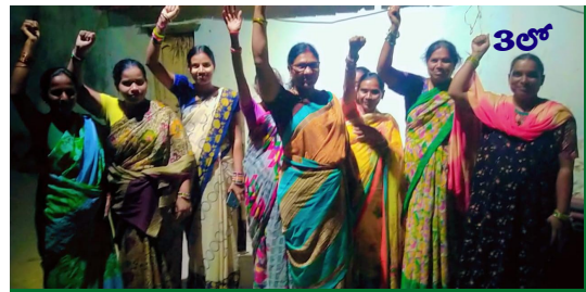
జిల్లాలో పాలిటికల్ వార్ ప్రకటించునున్న మహిళలు

Published from Hyderabad, circulated to:Hyderabad, Nalgonda, Khammam, Rangareddy, Sangareddy, Warangal, Mbnr, Kurnool, Kadapa, Amaravathi,Krishna