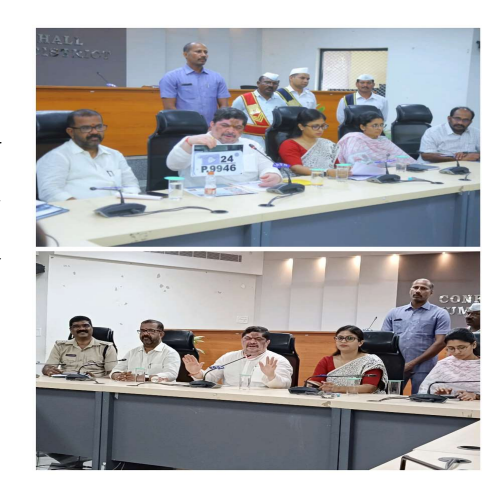
కేంద్రం నుండి అనుమతులు వచ్చాయన్నారు. టీఎస్ కు

హనుమకొండ ప్రతినిధి, మార్చి 14 (పీసీడబ్ల్యూ న్యూస్): తెలంగాణ రాష్ట్ర ప్రజల ఆకాంక్ష మేరకు వాహనాల రిజిస్టేషన్లకు బీఎస్ కు బదులుగా టీజీ అనే పదాన్ని తీసుకురావడం జరిగిందని రాష్ట్ర రవాణా, బీసీ సంక్షేమ శాఖ మంత్రి పొన్నం ప్రభాకర్ అన్నారు. గురువారం హనుమకొండ జిల్లా కలెక్టరేట్ లోని కాన్ఫరెన్స్ హాలులో ఏర్పాటుచేసిన మీడియా సమావేశంలో రాష్ట్ర రవాణా, బీసీ సంక్షేమ శాఖ మంత్రి పొన్నం ప్రభాకర్ మాట్లాడుతూ.. తెలంగాణ రాష్ట్రం ఏర్పడిన తర్వాత జూన్ 2 ఆవిర్భావ తేదీన కేంద్ర ప్రభుత్వం వాహనాలకు టీజీ అని గెజిట్ ఇచ్చిందని అన్నారు. ఐఏఎస్ అధికారుల ఐడి కార్డులు గాని, ఇతర్రతా కేంద్రం గుర్తించిన ప్రతి అంశానికి సంబంధించి టీజీ అని ఉంటుందన్నారు. ఒక రవాణా శాఖకు మాత్రం ఏ ఉద్దేశమో కానీ ప్రభుత్వం ఆనాడు 17 రోజుల తదుపరి తిరిగి ప్రభుత్వం నుంచి మళ్లీ కేంద్ర ప్రభుత్వానికి నివేదిక ఇచ్చి టీఎస్ గా మార్చిం దన్నారు. కాంగ్రెస్ ప్రభుత్వం అధికారంలోకి వచ్చిన తర్వాత క్యాబినెట్ తీర్మానం మేరకు కేంద్ర రవాణా శాఖ మంత్రి నితిన్ గడ్కరీ కి రాష్ట్ర ప్రభుత్వం తరఫున క్యాబినెట్, శాసనసభ