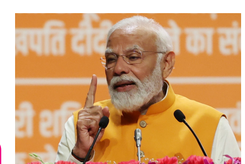
ධීৰ సాంకేతిక విప్లవంలో

పేరుతోనే ఉంటాయని స్పష్టం చేశారు. అంతకు ముందు సీఎం