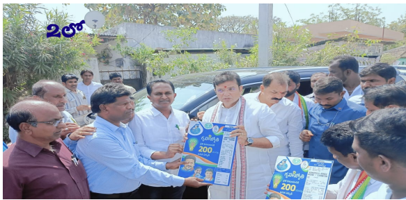
ప్రతి గ్యారంటీ పథకాన్ని తప్పనిసరిగా అమలు చేస్తాం