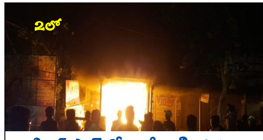
ఎలక్ట్రికల్ షాప్ లో భారీ అగ్ని ప్రమాదం

Published from Hyderabad, circulated to:Hyderabad, Nalgonda, Khammam, Rangareddy, Sangareddy, Warangal, Mbnr, Kurnool, Kadapa, Amaravathi,Krishna