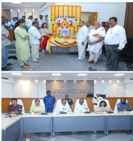
అందించిన సేవలను స్మరించుకోవడం సముచితమన్నారు. శ్రీపాద రావు కు ఉమ్మడి వరంగల్ జిల్లాలో అనుబంధం ఉందని, గతంలో తనకు కూడా వారితో కలిసి కొన్నిసార్లు పని చేసే