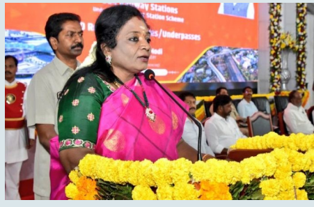
హైదరాబాద్,ఫిబ్రవరి 28 (పిసిడబ్ల్యూ న్యూస్): తెలుగు ప్రజలు ఇతరులకు తెలుగు భాషను నేర్పించాలని గవర్నర్ తమిళిసై తెరిపారు. తెలుగు వర్సిటీ స్నాతకోత్సవంలో గవర్నర్ తమిళి సై సౌందరరాజన్ పాల్గొన్నారు. ఆమె ప్రసంగించారు. తక్కువ ఖర్చుతో తెలుగు భాష పుస్తకాలను ప్రచురించాలని, నా మాతృభాష తమిళం అని, తెలుగు నేర్చుకుని మాట్లాడటం ఎంతో సంతోషంగా ఉందన్నారు. ప్రగతి సాధించడానికి శ్రమే ఆధారమని, షార్ట్ కట్ ఉండదని తమిళిసై పేర్కొన్నారు.