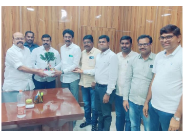
ప్రభుత్వ డిపార్ట్మెంట్ లోని ఉద్యోగులు కూడా సదానందం అభ్యర్థిత్వాన్ని ఆహ్వానిస్తున్నారు.