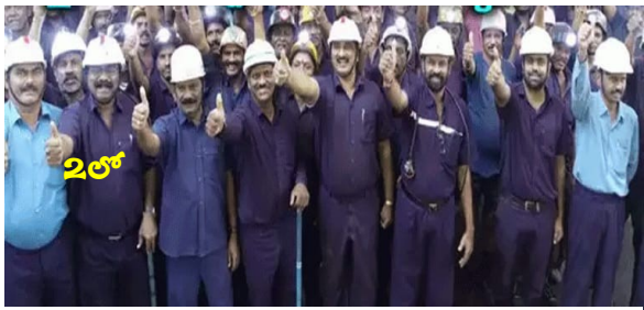
సింగరేణి ఉద్యోగులకు రేవంత్ సర్కార్ శుభవార్త..