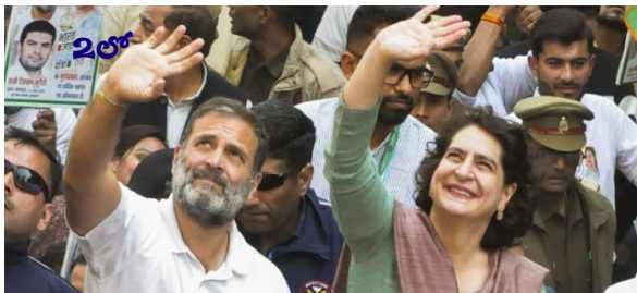
భారత్ జోడో న్యాయ యాత్రలో ప్రియాంక