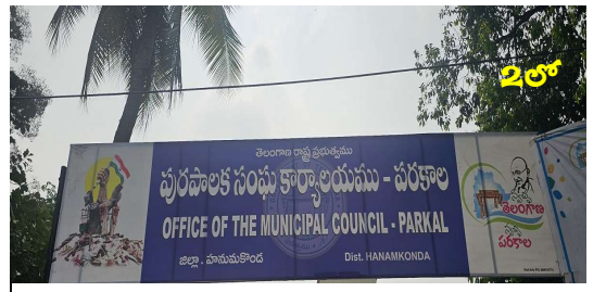
గోడ మీద పిల్లుల్లా కౌన్సిలర్లు!?

Published from Hyderabad, circulated to:Hyderabad, Nalgonda, Khammam, Rangareddy, Sangareddy, Warangal, Mbnr, Kurnool, Kadapa, Amaravathi,Krishna