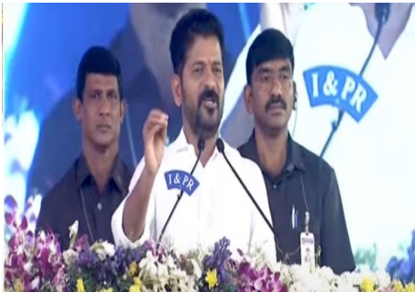
హైదరాబాద్, ఫిబ్రవరి 15 (పిసిడబ్ల్యూ న్యూస్)

కాంగ్రెస్ గెలుపులో నిరుద్యోగుల కృషి మరువలేనిదని ముఖ్యమంత్రి రేవంత్ రెడ్డి అన్నారు. గురువారం హైదరాబాద్ విట్టి స్టేడియంలో నూతనంగా ఎంపికైన 2వేల మంది గురుకుల టీచర్స్, లైబ్రేరియన్ల అభ్యర్థులకు ఉద్యోగ నియామక పత్రాలను సిఎం రేవంత్ రెడ్డి అందజేశారు. ఈ సందర్భంగా ఆయన మాట్లాడుతూ.. నిరుద్యోగులు ఉద్యోగాల కోసం కోట్లాదారని.. ఎంతో మంది విద్యార్థులు అమరులయ్యారని చెప్పారు. గత